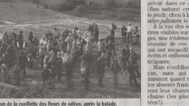
Initiation de la cueillette des fleurs de safran, après la balade.

Pour leur troisième édition, les balades safrannières des 4 et 11 novembre ont remporté un énorme succès auprès d'un public cosmopolite. L'association Les Roches Rouges a accompagné plus de 200 personnes sur le chemin de Caylus, pour une promenade champêtre en direction de la safranrière, dans ce lieu magique des Costes Hautes. À l'issue de près de 2 heures de marche, les randonneurs ont pu s'initier à la cueillette des fleurs de safran, puis à l'émondeage des précieux stigmates.