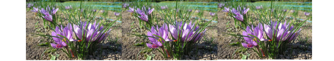
Après une matinée sportive et bucolique, les estomacs étaient prêts à rendre hommage aux cuisiniers du jour.

À l'unanimité, tout le monde a déploré l'abattage du peuplier, dont l'imposante stature fait partie intégrante de la place depuis plusieurs générations. Une décision sera prise avant la fin de l'année. Elle privilégiera la sécurité, un point crucial au cœur du débat. ●