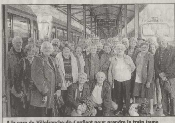
A la gare de Villefranche-de-Conflent pour prendre le train jaune.

Les adhérents de l'association des Seniors des Neuf-Fiefs sont dernièrement partis à l'assaut des Pyrénées. Au programme de la journée, commenté avec beaucoup d'humour par Marc, la visite libre de Villefranche-de-Conflent, très joli village fortifié par Vauban. Puis direction Mont-Louis, pour un trajet qui fut l'occasion d'admirer les ouvrages d'art, qui permettent au petit train jaune de circuler à travers des paysages grandioses jusqu'à la Tour de Carol. Après un bon déjeuner, chacun a pu se promener à sa guise dans les petites rues de Mont-Louis et admirer le premier four solaire du monde (sous la pluie...). Puis le car a repris sa route jusqu'à Port-Romeu, pour y découvrir le four solaire d'Odeillo, un des deux plus grands du monde. Enfin, il restait encore à