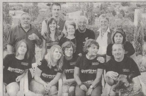
L'équipe de la Neffiesta au grand complet, prête pour les 3 jours de fête.

Programme de la fête annuelle : demain , à 20 h grillade et musique avec DJ Dovic. Samedi 3 , de 10 h à 12 h 30, animation gratuite pour les enfants avec Artishow ; 19 h 30, soirée animée par Sergio music. Paela + dessert (vin compris) : 12 €, menu enfants : 5 € (sur réservation dans les commer-