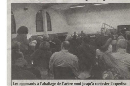
Les opposants à l'abattage de l'arbre vont jusqu'à contester l'expertise.

Une réunion publique à l'invitation de la municipalité a attiré un très grand nombre de personnes dans la salle polyvalente. Il est vrai que l'ordre du jour était particulièrement riche en informations concernant l'avenir du village mais, c'est sans surprise que le sujet qui a suscité le plus de réactions est le peuplier noir de la place Paul-Gauffre, aussi appelé "l'Arbre de la liberté".